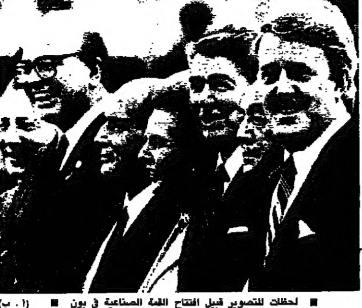
لمحادثات للتصوير قبل افتتاح القمة الصناعية في بون (١٠ ب)

اجتمع الزعماء السبعة الذين يحضرون مؤتمر القمة الاقتصادي الغربي في اعلان سياسي على تاييد الولايات المتحدة في محادثات الاسلحة التي تجريها مع موسكو، إلا أنهم فيما يبدو قد انقسموا في الرأي بشأن محادثات التجارة ونيكاراغوا. وعلى الصعيد الاقتصادي اعترضت فرنسا على عقد جولة جديدة من المحادثات التجارية العلنية التي كان الزعماء الستة الآخرون ياملون لها ان تبدأ في عام ١٩٨٦.